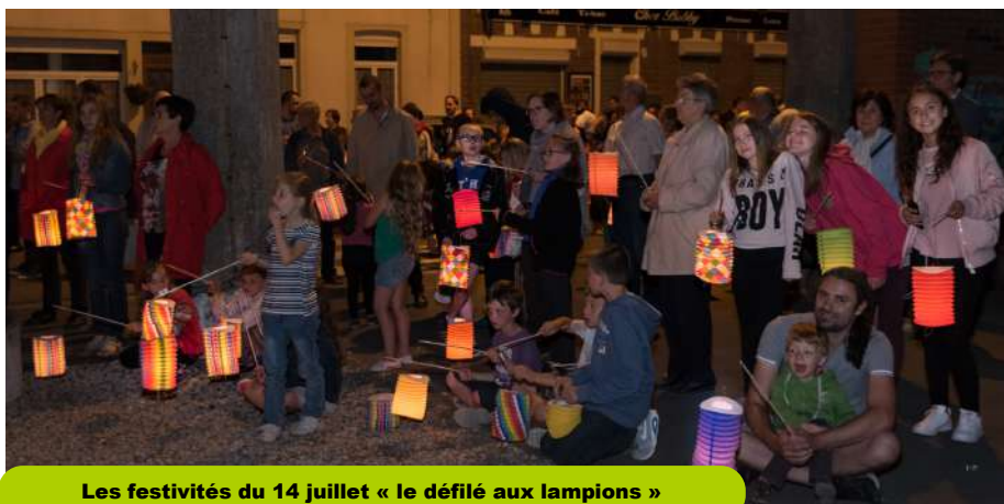
Les festivités du 14 juillet « le défilé aux lampions »