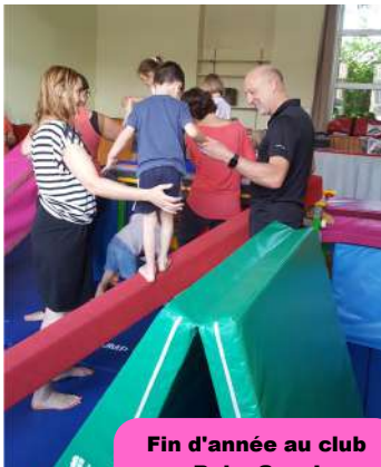
Fin d'année au club Baby Gym !