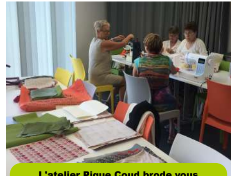
L'atelier Pique Coud brode vous accueille à la salle polyvalente tous les vendredi 14-17h