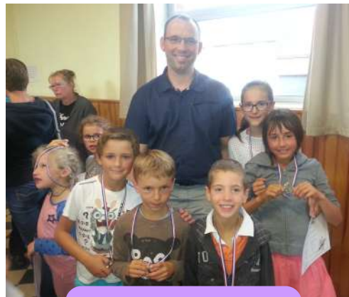
La remise des diplômes de fin d'année à la musique !