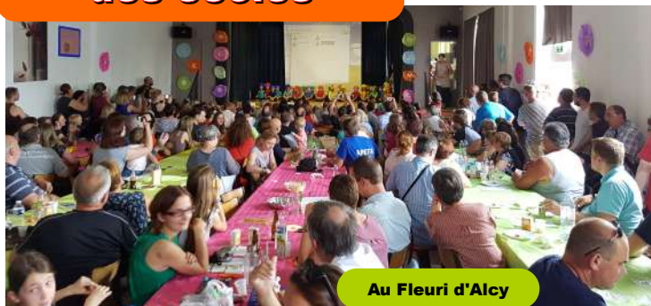
Au Fleuri d'Alcy