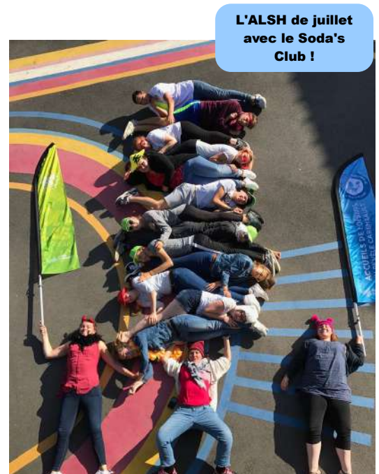
L'ALSH de juillet avec le Soda's Club !