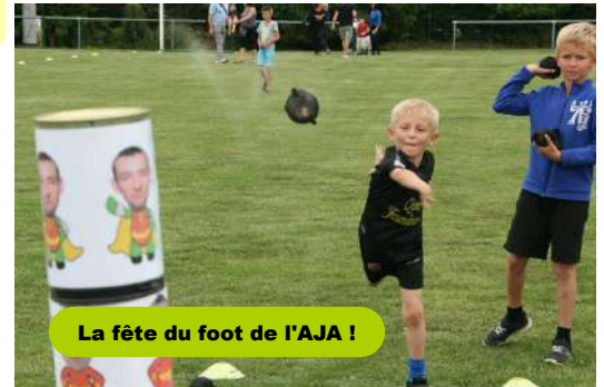
La fête du foot de l'AJA !