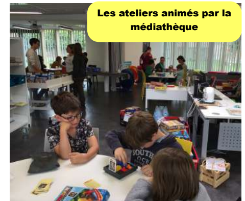
Les ateliers animés par la médiathèque